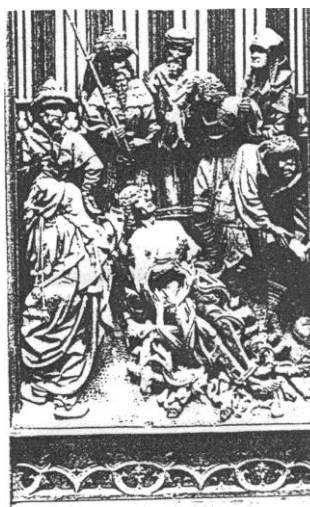
SAINT GEORGES EST BRULE