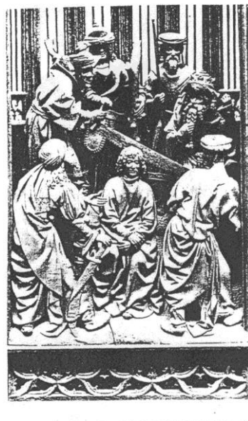
SAINT GEORGES A LA TETE SCIEE