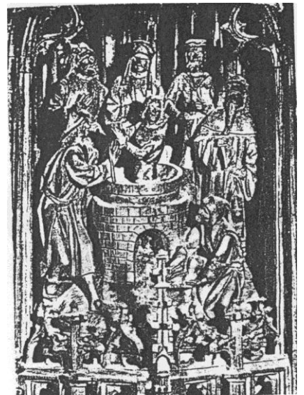
SAINT GEORGES EST MIS DANS UNE CHAUDIERE